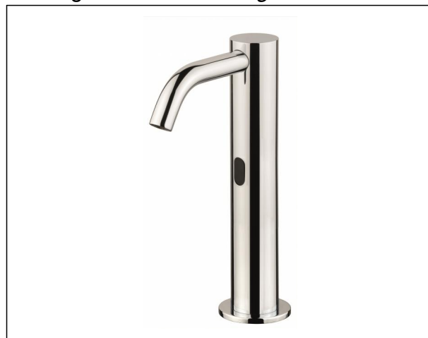
Immagine / Picture / Image