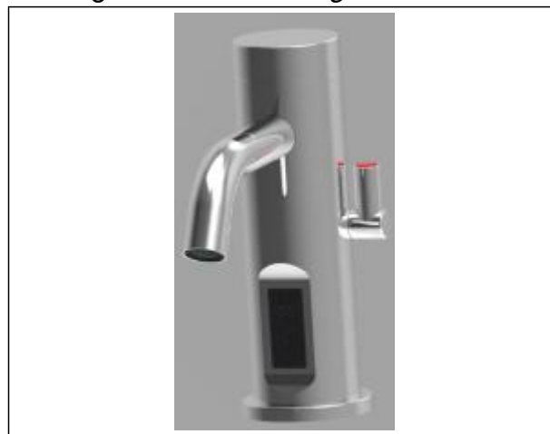
Immagine / Picture / Image